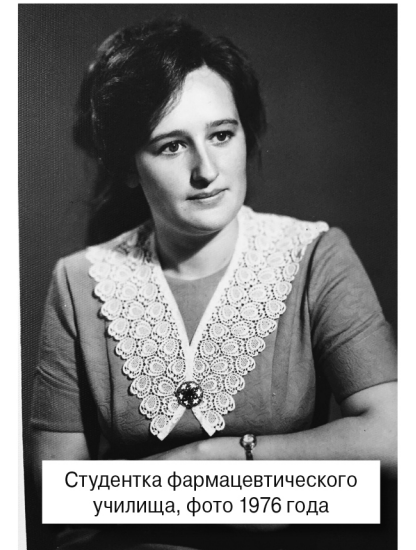
Студентка фармацевтического училища, фото 1976 года